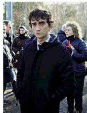
La politica Sopra, il sindaco Lepore (con il generale Stefanini) e qui sopra il viceministro Galeazzo Bignami di Fratelli d'Italia