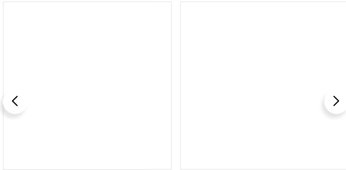
GIACCONE IN ECOAGE