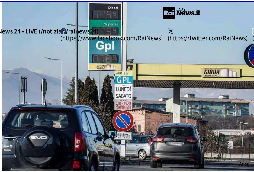
Distributore di benzina

È il Codacons a lanciare l'allarme sugli effetti del caro-benzina sui ponti di primavera. L'associazione ha fatto una vera e propria mappa nazionale del caro-benzina. Venerdì 12 aprile il prezzo più alto è stato praticato sulla A21 Piacenza-Brescia, dove un litro di verde servito era 2,549 euro. Sempre nello stesso giorno e sulla A21, ma in provincia di Alessandria, le benzina ha raggiunto nella stessa data 2,499 euro al litro. È la provincia di Benevento con prezzi più alti e che hanno superato quota 2,5 euro al litro, con listini rispettivamente di 2,572 e 2,550 euro/litro. In provincia di Modena si segnalato 2,509 euro al litro. Poi viene segnalato lo strano caso di un distributore in via Lungolago di Capolago a barese, che il 12 aprile ha fatto sapere il Ministero delle Imprese e del Made in Italy, un prezzo pari a 2,854 al litro per la benzina.