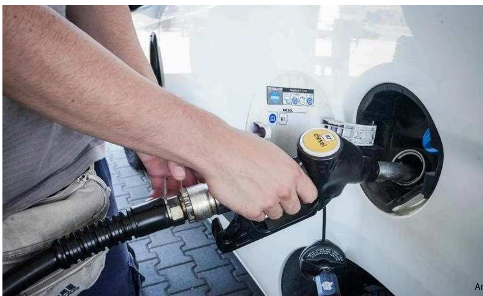
benzinaio in una stazione di servizio dell'autostrada