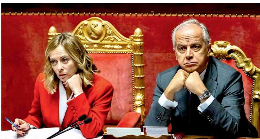
La premier e il ministro Giorgia Meloni col ministro dell'Interno Matteo Piantedosi

I manifesti comparsi ieri a Bologna che annunciano il No Meloni day degli studenti, venerdì, macchiati da impronte rosse. Protesta il centrodestra