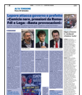
Peso: 25-1%, 26-62%